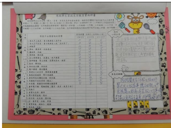
照片說明：中年級學習單