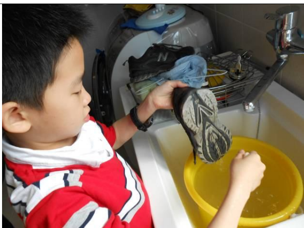
照片說明：自己清洗鞋子