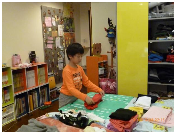
照片說明：自己整理自己房間