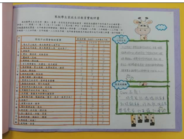
照片說明：高年級學習單