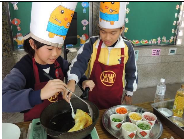
照片說明：炒飯、煎蛋