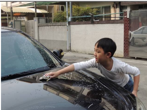
照片說明：會幫忙擦車、洗車