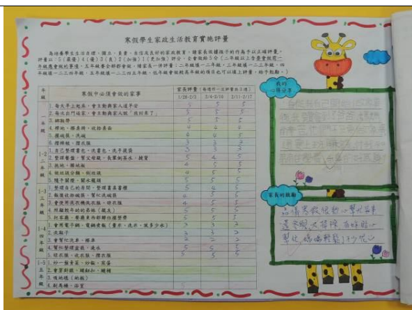
照片說明：中年級學習單