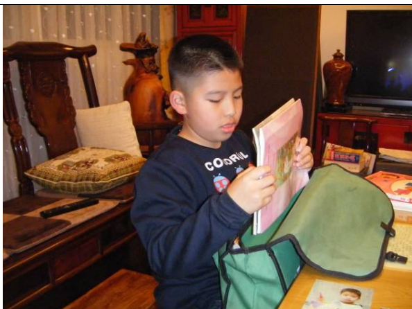
照片說明：自己整理書包