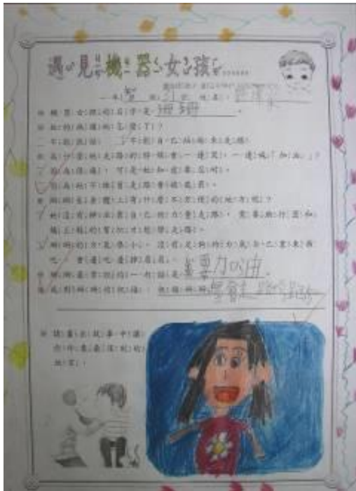
希望珊珊學會走路、跑步