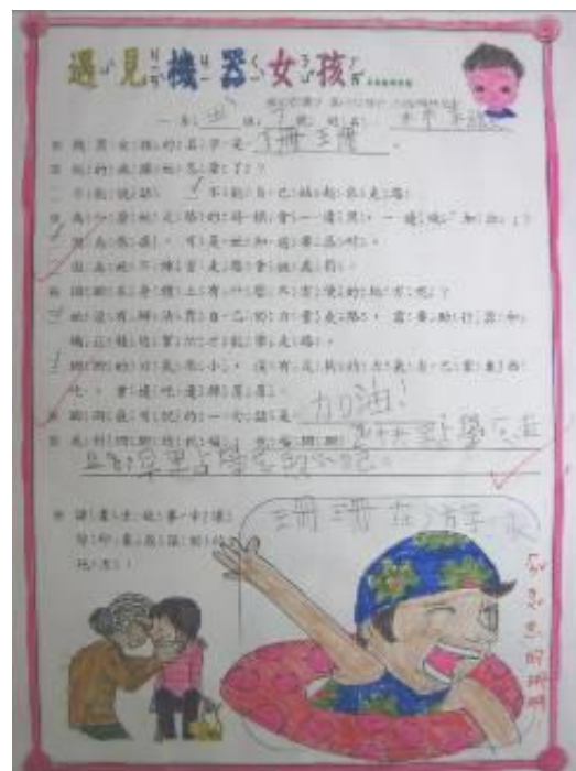
祝福珊珊早點學會照顧自己