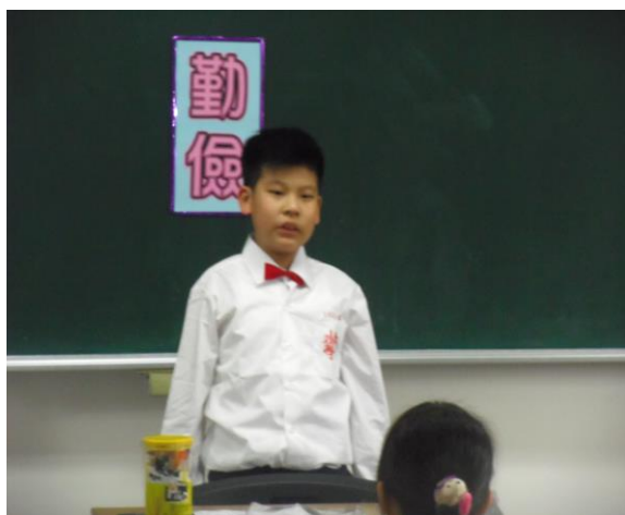
照片說明：分享勤儉故事