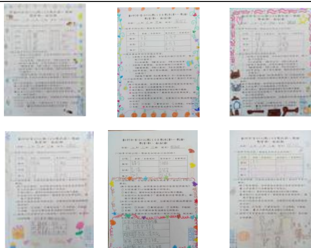
照片說明：學習單作品