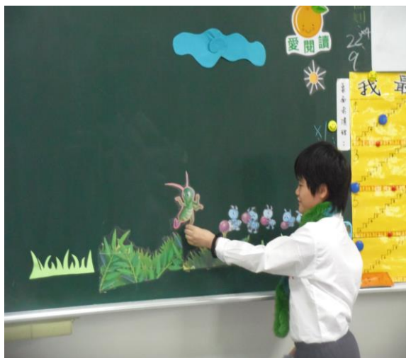
照片說明：創作故事