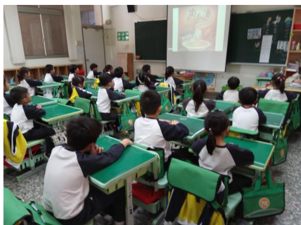
照片說明：繪本 ppt：南瓜湯