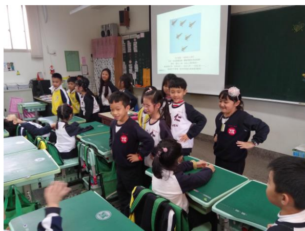
照片說明：同心協力發揮大雁的精神