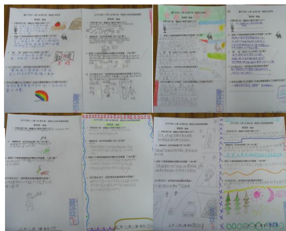
照片說明：分享我們的學習單