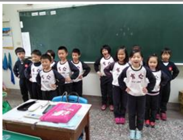
照片說明：合作遊戲 / 移動的三角形