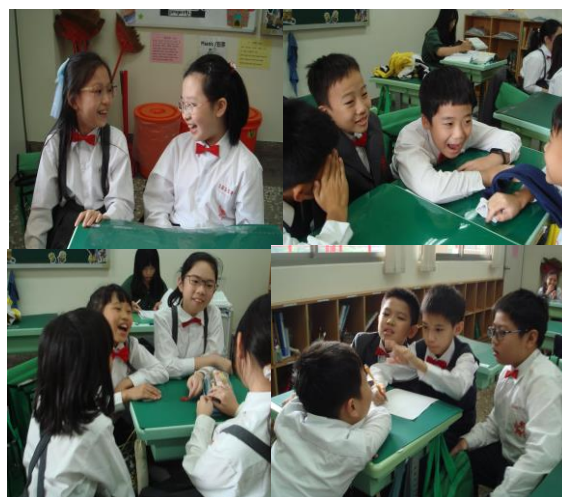
照片說明：分組討論